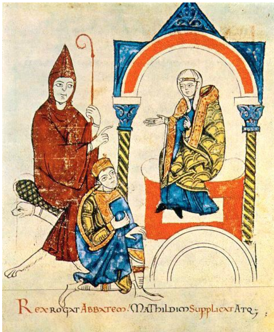
Kejser Henrik IV ifølge med en abbed fra Cluny beder hertugunde Mathilda hjælpe sig i forholdet til pave Gregor VII Illustration fra håndskriftet 'Mathildas liv '(Vita Mathildis) fra ca. 1115

Paverne havde gjort sig afhængige af den franske konge og flyttede til Avignon i Frankrig 1309-1377. I denne periode, som nogen kalder pavens babilonske fangenskab, residerede i rækkefølge 7 paver, alle franskmænd, indtil Gregor XI flyttede tilbage til Rom. Men han døde allerede året efter tilbagekomsten, og nu slog modsætningen mellem de franske kardinaler og de italienske ud i lys lue. Kirken blev i stigende grad truet af nationale tendenser, og i en periode opstod det store skisma med en pave både i Avignon og en anden i Rom. Man forstår godt, at Dantes samtidige, filosofen Marsilius af Padua i sit skrift Defensor Pacis 'Fredens Forsvarer' fra 1324 tog klart afstand fra, at paven skulle have nogen særlig magt, i hvert fald ikke på det ikke-religiøse område. Marsilius gik med forbillede i Aristoteles endog så vidt, at han mente, at magthavere kunne vælges af folket - en opfattelse, der ikke umiddelbart slog igennem, men som dog nok kunne understøtte de selvstændige by-republikkers politiske indretninger både i Syd og i Nordeuropa. Marsilius var formentlig del af den bevægelse, der anså indførelsen af koncilier, forsamlinger af biskopper og andre af kirkens mænd, som vejen frem og ud af uføret.