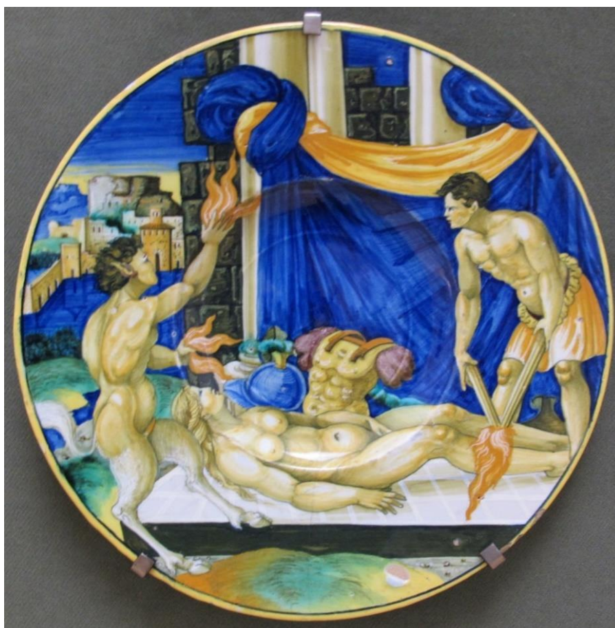
Maiolica-arbejde med allegorisk fremstilling af lidelserne under Il Sacco di Roma. Francesco Xanto Avelli (1528-1531).