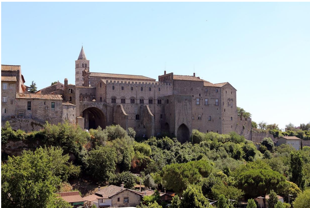
Pavernes palads i Viterbo