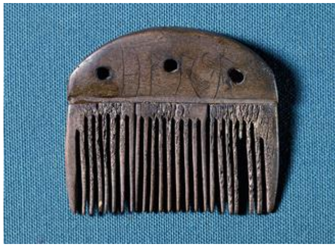
Kam fra Viemose med de ældste kendte runer fra 1. årh. e.v.t.

Lad os blive lidt i det sproglige hjørne. Vores forfædre har helt givet fået inspirationen til deres runealfabet, Futhark, sydfra. Den ældste kendte runeskrift i hele verden er fra et dansk fund fra ca. 150 e.v.t. ved Viemose på Fyn. Det drejer sig om en kam af ben med indskriften harja , måske et navn eller ordet 'kam'. Futhark består af enkelte bogstaver nogle med tilsyneladende lån fra det latinske, nogle fra det græske og nogle fra det etruskiske alfabet. Men nogle af bogstavernes lyde er baseret på det oldnordiske sprog og er uden sammenhæng med forbillederne. Nyere forskning peger på, at runealfabetet er en imponerende nordisk, selvstændig frembringelse, der må have stillet endog meget store krav til viden om sprog, lyde og grammatik. Og det i en verden fuldstændig uden eksisterende skriftlig tradition. Man mener, at kun ganske få i begyndelsen har været i stand til at skrive og læse runerne, der muligvis har været tillagt en magisk kraft. Ikke mindst de mange runesten sat senere som minder over afdøde kan have haft en religiøs betydning. Men runeskrift i forskellige udgaver blev faktisk brugt som daglig skrift helt frem til ca. 1200 e.v.t.