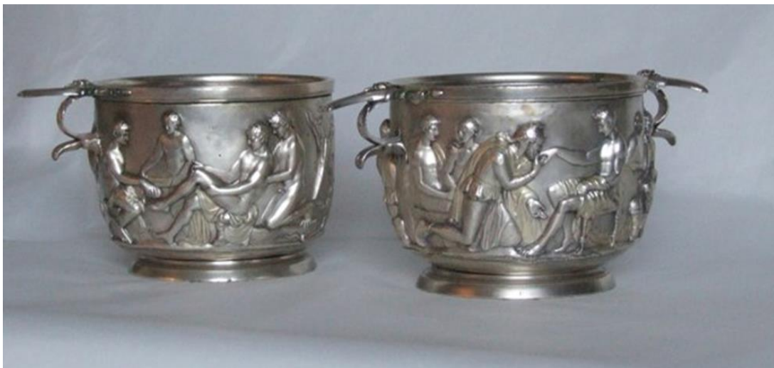
Sølvdrikkebægrene fra Hoby. Billederne er illustrationer fra Iliaden. Til højre ser man kong Priamos af Troja, der bønfalder Achilleus om at få udleveret Hectors lig. Til venstre får Filoktet vasket sine fødder efter et slangebids. Hvem ved, måske kendte eliten på Lolland til historierne fra Iliaden? Bægrene kan ses på Nationalmuseet – med mindre de er udlånt til særudstillinger.

Udgravninger i Hoby har i øvrigt afsløret, at det største hus i bebyggelsen nær ved gravene ikke som vanligt var med både stald og bolig i samme hus. Måske har man flyttet stalden under indtryk af mere civiliseret levevis nede i Romerriget? En forsmag på de store forsamlingshuse i vikingetiden? Men dermed er ikke sagt, at dyrene var uden betydning. For naturvidenskabelige undersøgelser af fåreknogler antyder, at fårene kunne være ekstra store og dermed gode uldproducenter gennem flere år. Måske kan man forestille sig, at der afgik baller med lollandsk uld til brug f.eks. i Köln?