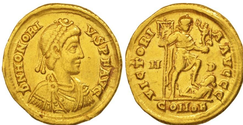
Romersk solidus med portræt af kejser Honorius, der var en svag vest-romersk kejser i en lang periode 395-426 e.v.t. Af ordet 'solidus' har vi fået både ordene soldat, sold og solid

i området efter devisen 'Divide et impera' d.v.s. 'Del og hersk'. Nogle mønter er blevet ofret til hjemlige guder, måske gravet ned i ufredstider og senere glemt, eller omsmeltet. F.eks. var de danske guldhorn, der siden blev stjålet og omsmeltede endnu en gang, måske fremstillet af omsmeltede solidi.