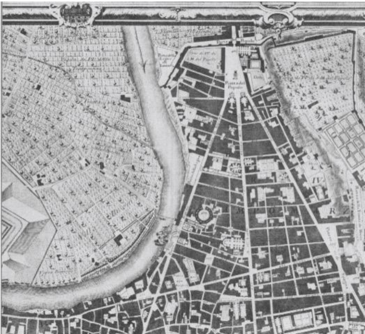
Nollis La Pianta grande di Roma fra 1736 består af 12 indgraverede kobberplader tryk, der kan sættes sammen til ét. Det fylder 176x208 cm

Det var heller ikke nogen nem opgave. Giambattista Nolli (1701-1756) var arkitekt, landinspektør og indfødt romer, og kortet - la pianta grande di Roma - var hans livsværk. Han trykte det i 12 ark, der alle skal passe sammen under skyldig hensyntagen til såvel detaljerigdommen som det forhold, at det 18. århundredes trykkes teknik ikke var så præcis, som vi forlanger det i dag. Det gælder også for moderne reproduktioner af kortet som vores, og løsningen er at tillade bittesmå forskydninger for at få det store billede til at passe. Det kræver både flair og fingerspidsfornemmelse såvel som takt og tålmodighed, for kortet skal ikke bare lede besøgende på rette vej. Med sine allegoriske figurer og sine tredimensionale, næsten teatraliske effekter sætter kortet så at sige sig selv i scene med sit bud på, hvad den evige stad kan gøre for resten af verden.