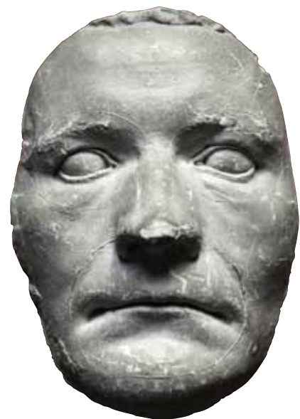
Det vides ikke , hvem der har lavet denne dødsmaske af Thorvaldsens ansigt, men den er fra 1844, hvor den store billedhugger gik bort.