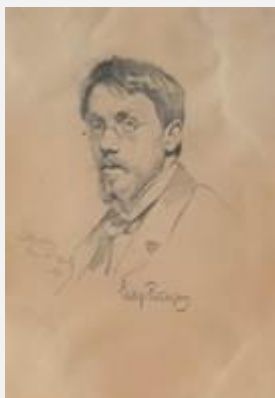
Hjalmar Eilif Pettersen, norsk maler, tegnet af P.S. Krøyer

Middag i cafeen og foredrag om Skandinavisk Forening