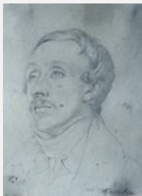
Albert Küchler's tegning af H. C. Andersen