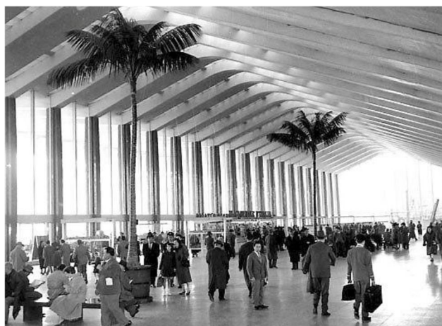
Sådan så hovedbanegården Roma Termini ud, da Mogens Bang kom til byen med toget i 1961. Bemærk palmerne.