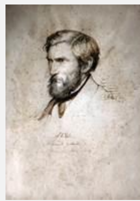
Den danske maler Claus Anton Kølle tegnat af Carl Bloch