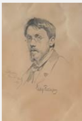
Hjalmar Eilif Pettersen, norsk maler, tegnat af P.S.Krøyer

Middag i cafeen og foredrag om Skandinavisk Forening