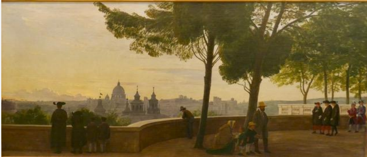
P.C. Skovgaard: Udsigt fra Monte Pincio mod Peterskirken 1861 (samme udsigt som i dag).

Vi gætter på at en hel del af vores medlemmer allerede har været i Rom. Men alligevel. Der kunne være slægtninge eller venner mfl. der kunne være potentielle nybegyndere!